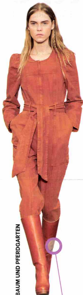
BAUM UND PFERDGARTEN