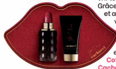
PAR VALENTINE BUVAT ET CÉLINE FAUCON | MAXTREE.COM; STEVE WELLS; CHRISTIAN VIGIER

Ce coffret festif est l'occasion de redécouvrir le flacon lipstick. Grâce à l'eau de parfum et au lait pour le corps, vous vous enveloppez de notes pétillantes de framboise, jasmin et gingembre. Coffret Yes I am, Cacharel, 70 €.