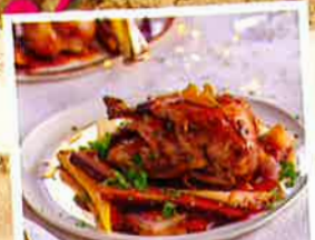
STÉPHANIE LE QUELLEC